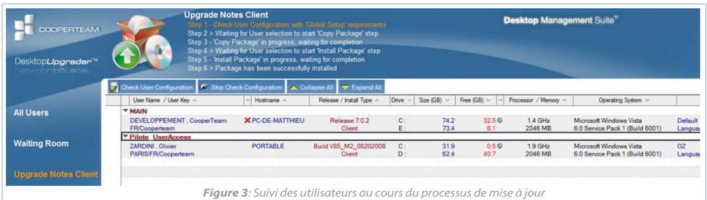
Figure 3: Suivi des utilisateurs au cours du processus de mise à jour